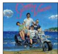
Gabriel y Vencerás «JUEGOS MEDITERRÁNEOS» HERMANOS SEGUNDOS

► Poques vegades disposa l'oient de tantes claus per esbrinar el contingut d'un disc. La pel·lícula One more time with feeling o les puntuals informacions sobre la mort accidental del fill de Cave l'estiu de l'any passat... Skeleton tree usa les cançons com a exorcisme del dolor, tot un clàssic de la música popular que, en aquesta ocasió, i per la dimensió de l'artista que s'enfronta al procés, ha provocat rius de tinta i opinions de tot tipus. Circumstàncies a part, però, en el nou àlbum del músic australià temes enriquits d'una gegant força emocional ( Distant sky ) cohabitaven amb altres que semblen encara en procés de creació. Davant aquesta realitat, que qualsevol pot comprovar fàcilment, un es pregunta si és possible que Cave tingués certa pressa per tancar el terrible episodi que el va traspalsar per sempre. Respectant la seva aflicció, és just reconèixer que la seva profitosa aliança amb Warren Ellis (vital avui com ho va ser Blixa Bargeld en el passat) ha donat millors obres que aquest treball, un àlbum precipitat, que peca de poca precisió i que no acaba de convèncer. Malgrat tot, Nick Cave segueix sent un dels artistes més preuats, emocionals i creatius que podem trobar en tot el planeta. (ROCK) | EDUARDO GUILLOT.