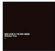
Nick Cave & The Bad Seeds «SKELETON TREE» KOBALT MUSIC GROUP

????? INDISPENSABLE ???? NOTABLE ??? RECOMANABLE ?? INTERESSANT ? FLUIX